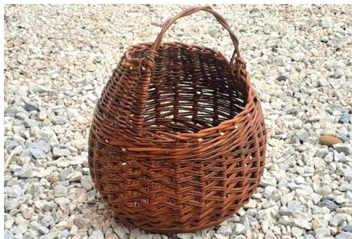
Le Panier asymétrique, Maïté Puil

Par Maïté Puil, Atelier Les Paniers de Maïté