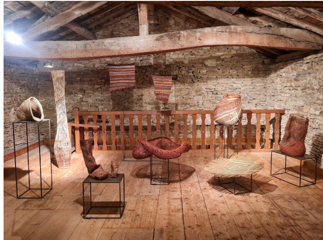
Aperçu de l'exposition « Un Brin d'Espoir » par L'Oseraie du Possible