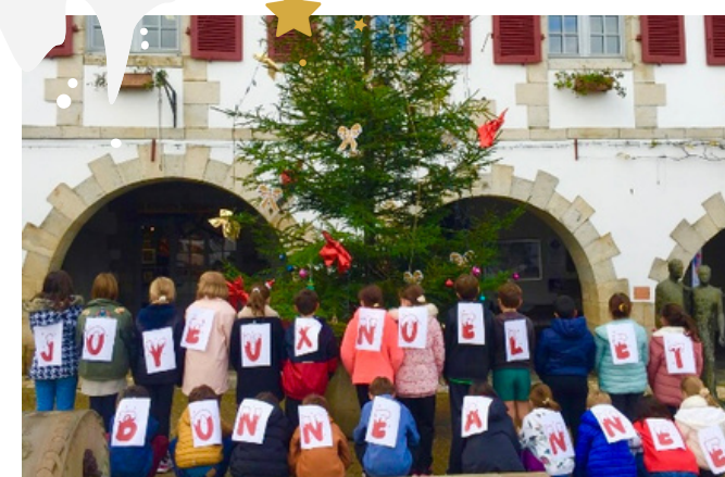
Belle contribution des écoles: affiches voeux & concours de couronnes pour décorer les sapins

Mairie - Place des Arceaux 64240 La Bastide-Clairence 05 59 70 29 10 mairie@labastideclairence.com www.labastideclairence.com labastideclairenceinfos