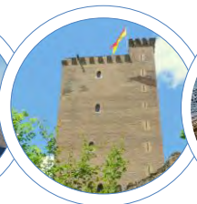
2016 Château de Montaner