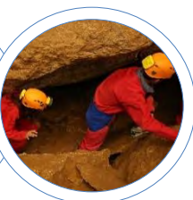
2019 Arette spéléo

Ce sont aussi des moments conviviaux pour tous ceux qui souhaitent s'intégrer dans la vie du village. Tous les parents sont les bienvenus pour aider l'Association, aide ponctuelle ou régulière, et ainsi soutenir les projets de l'école publique