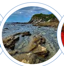
2018 Bayonne Anglet Hendaye